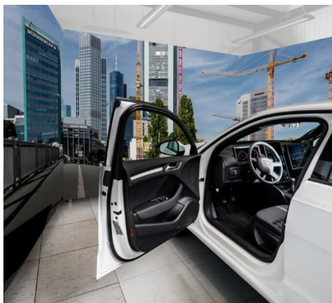
Abb. 2 Zur Durchführung von Studien und Datensammlungen bietet das Fraunhofer IOSB einen Fahr Simulator mit umfangreicher Sensorik im Fahrzeuginnenraum.